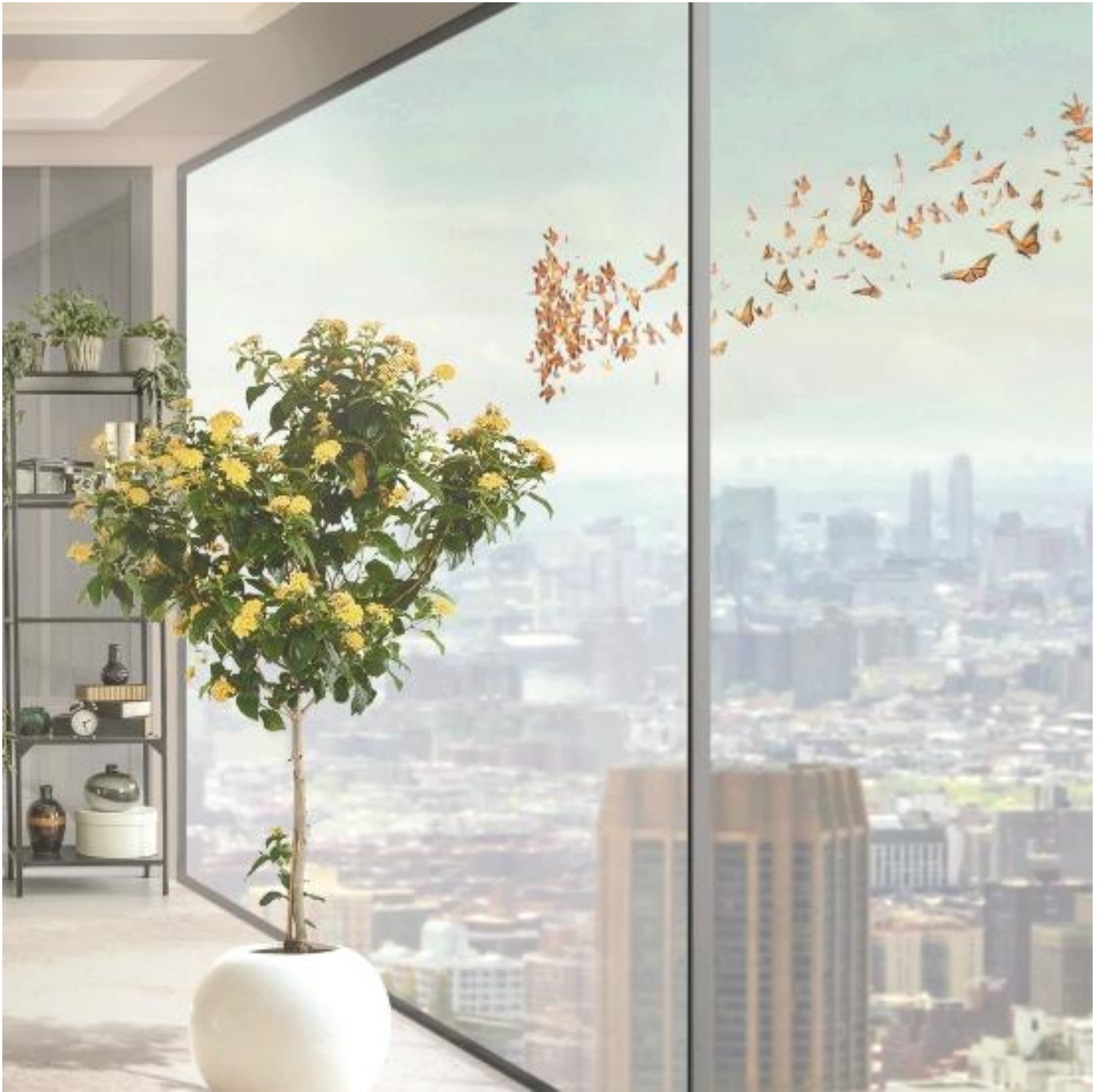
COOL-LITE® XTREME 70/33