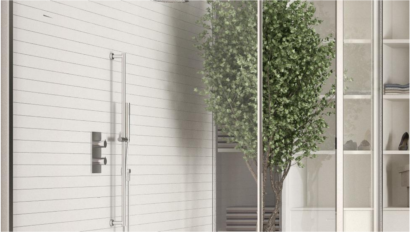
Inloopdouche met de glazen TIMELESS GLASS SHOWER douchewand