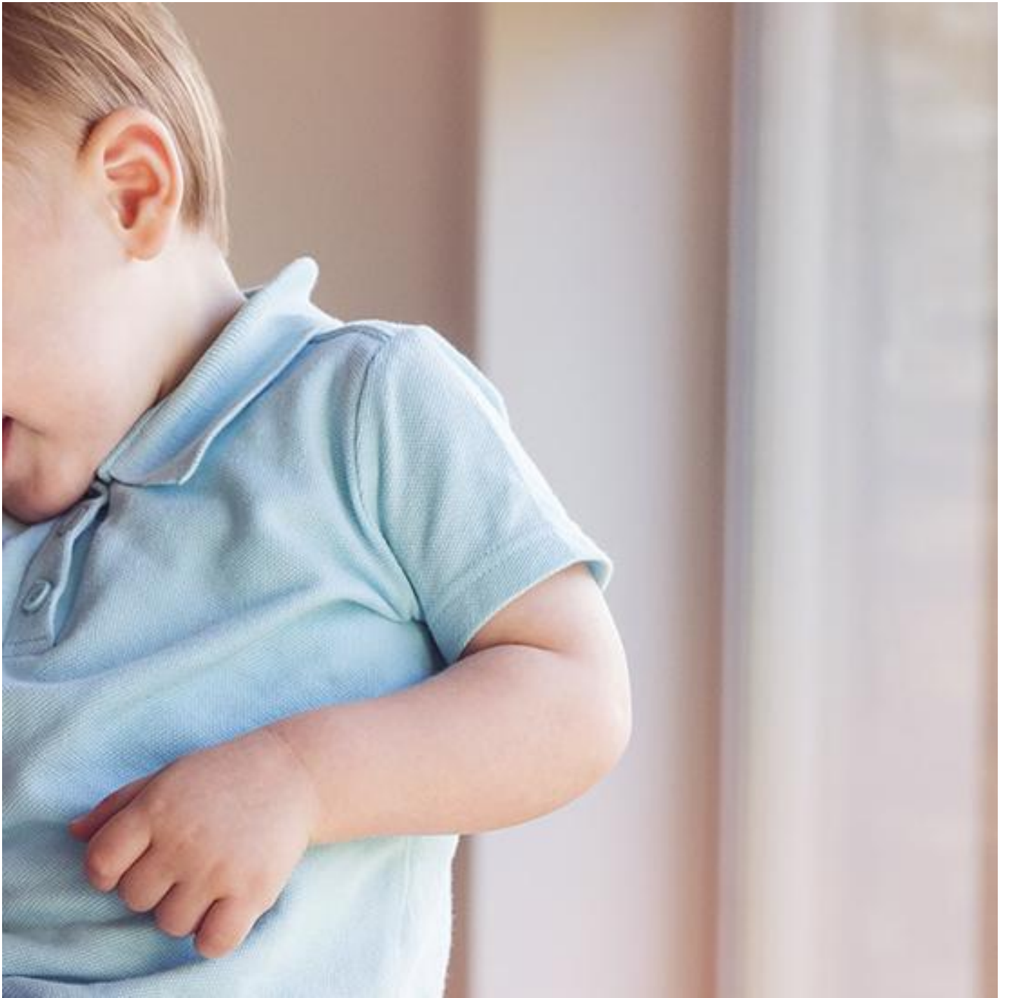
PLANITHERM® Clear 1.0