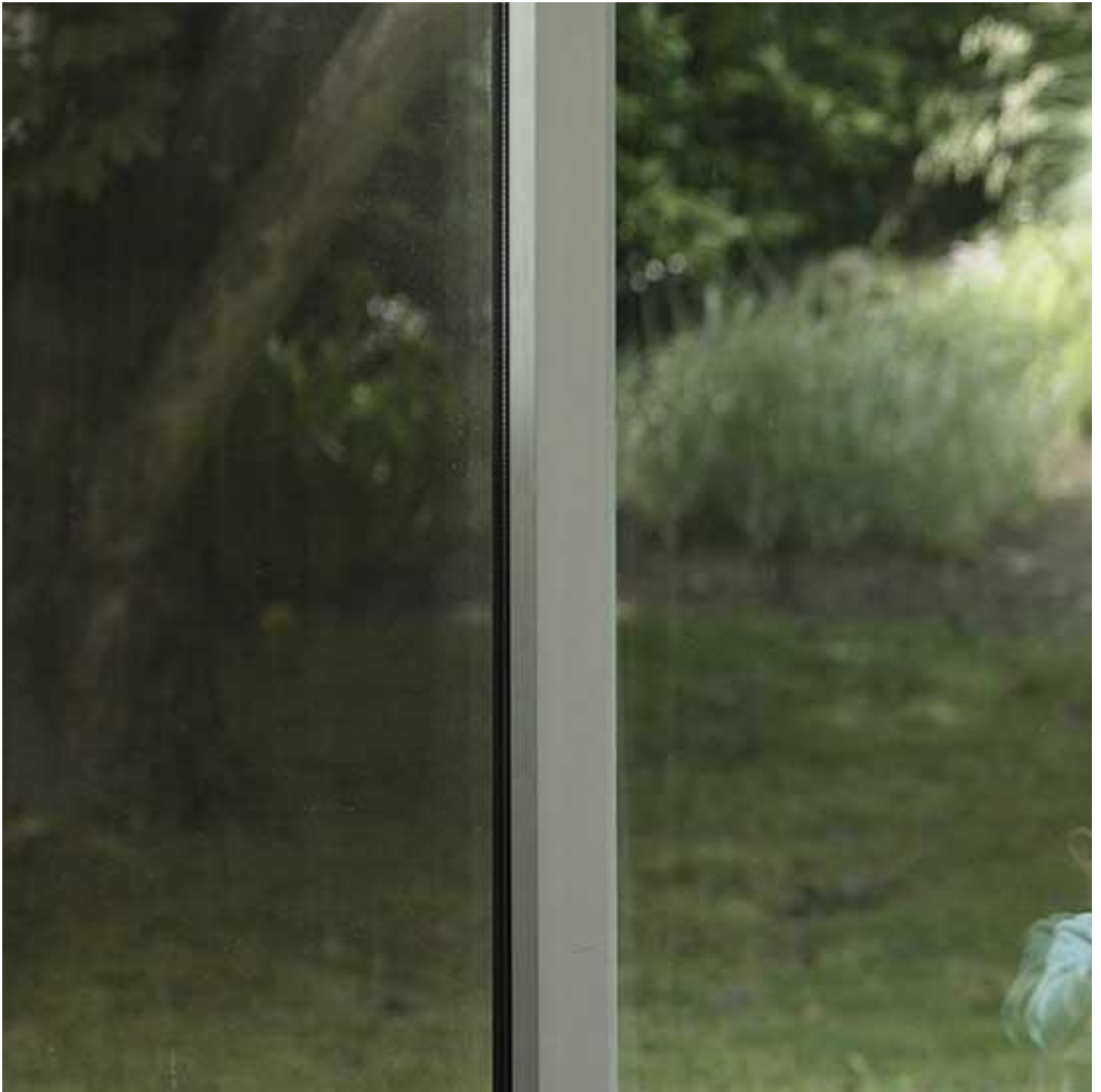
STADIP e STADIP PROTECT